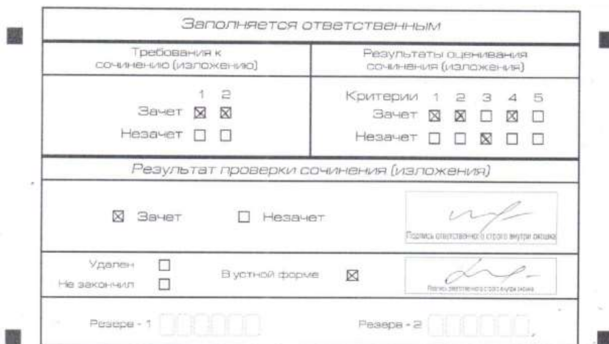
Рис. 9. Область для оценки работы сочинения (изложения) в устной форме

После окончания заполнения бланка регистрации ответственное лицо ставит свою подпись в специально отведенном для этого поле.