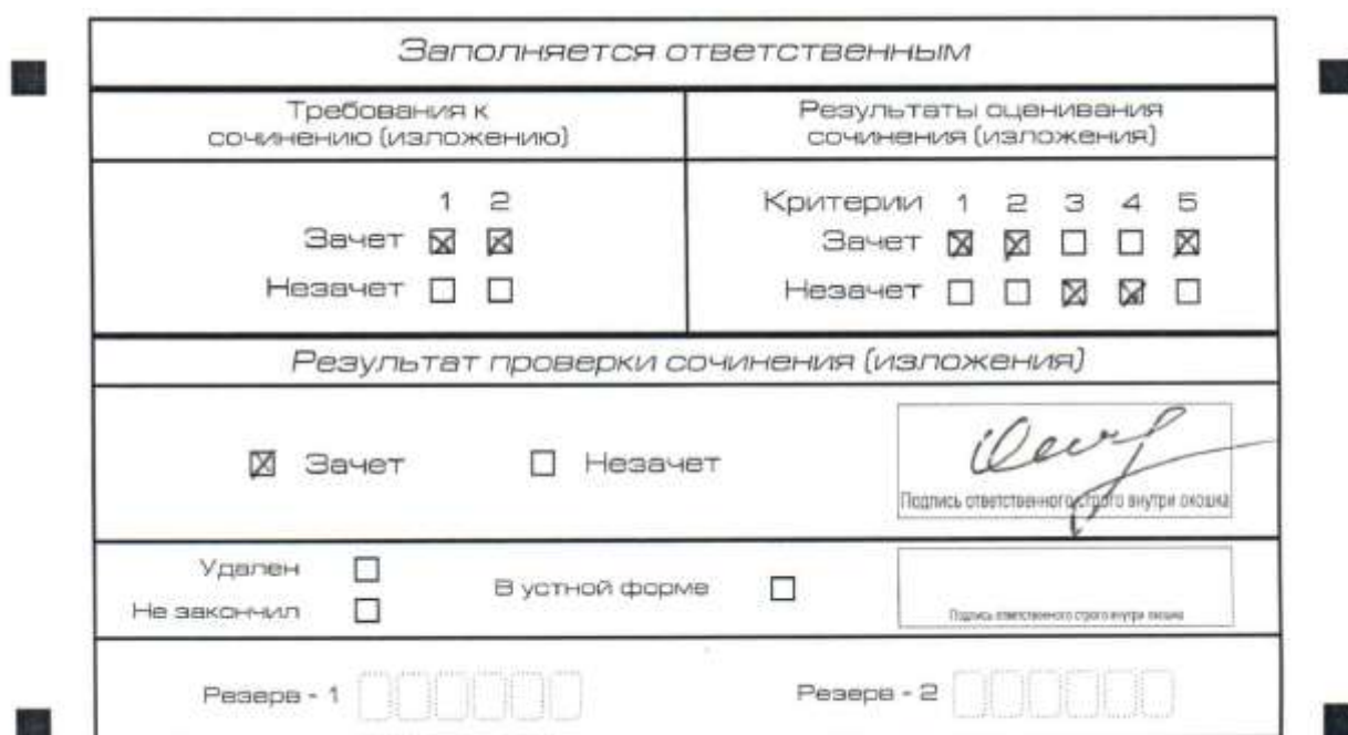
Рис. 8. Область для оценки работы

3. Во всех остальных случаях сочинение (изложение) проверяется по всем пяти критериям и оценивается по системе «зачет»/«незачет» (например, нельзя не проверять работу по критериям К4 и К5, если выпускник получил зачет на основании зачетов по критериям К1, К2, К3).