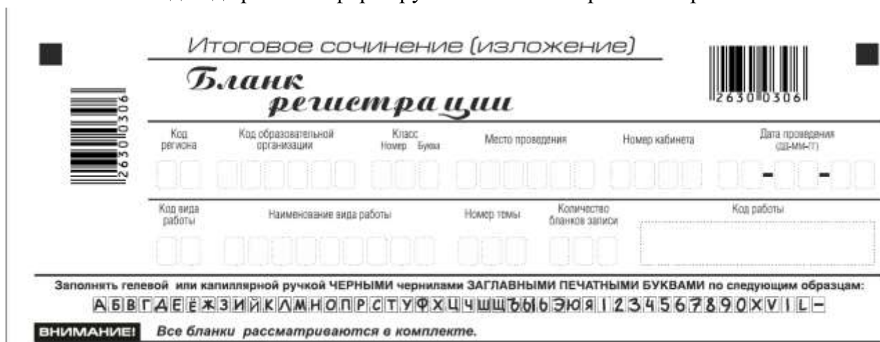
Рис. 2. Верхняя часть бланка регистрации

По указанию члена комиссии образовательной организации, осуществляющего инструктаж участников итогового сочинения (изложения), участником заполняются все поля верхней части бланка регистрации (см. табл. 1).